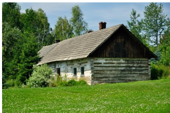
Ryc. 3 Przykład budynku mieszkalnego z przełomu XIX i XX w – Szynwałd 178