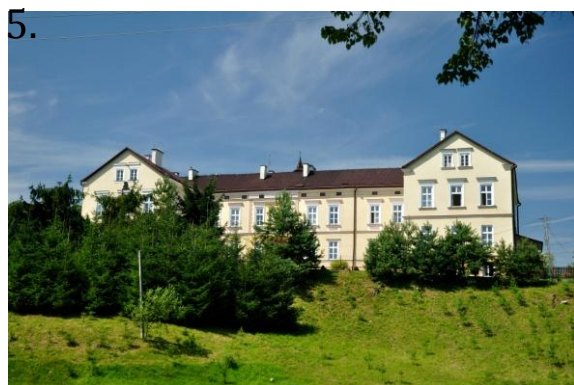
Ryc. 1 Dom zakonny SS. Służebniczek NMP z II poł. XIX w

Wśród nielicznych już dziś pozostałości tradycyjnej zabudowy mieszkalnej i gospodarczej na szczególną uwagę zasługują: chałupa z 1900 r. w Szynwałdzie - nr 285, dom z 1900 r. w Szynwałdzie - nr 178, a także kierat z 1925 r. w Szynwałdzie - przy domu nr 292.