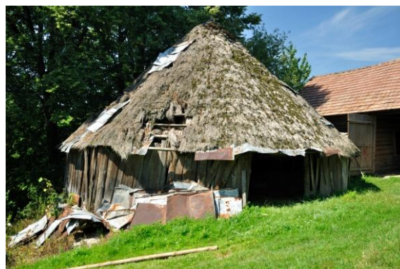
Ryc. 4 Kierat z 1925 r. - Szynwałd 292