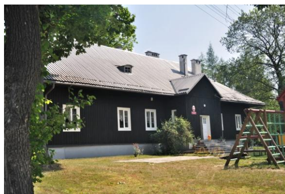
Ryc. 2 Dworek w Skrzyszowie