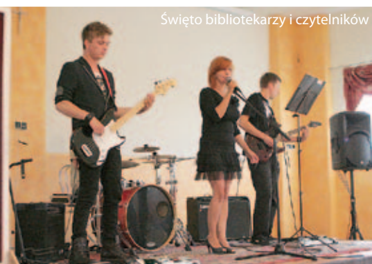
Święto bibliotekarzy i czytelników