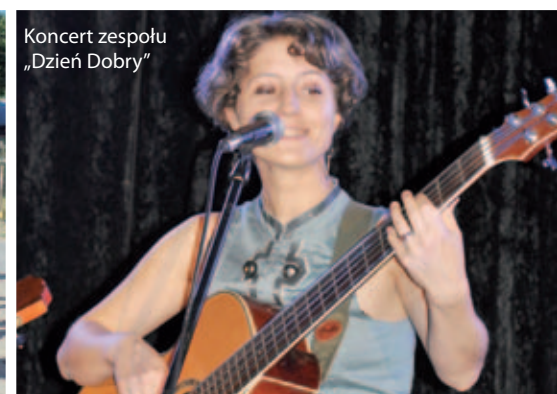
Koncert zespołu „Dzień Dobry”