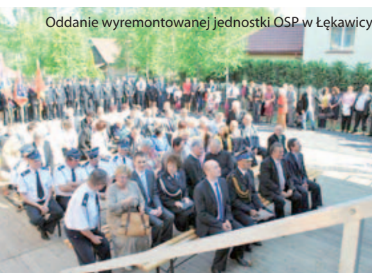
Oddanie wyremontowanej jednostki OSP w Łękawicy