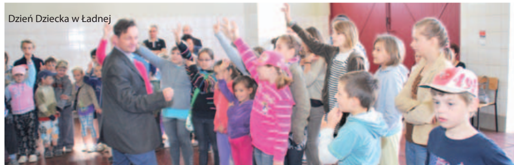
Dzień Dziecka w Ładnej