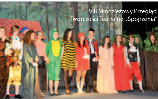
VIII Młodzieżowy Przegląd Twórczości Teatralnej „Spojrzenia”